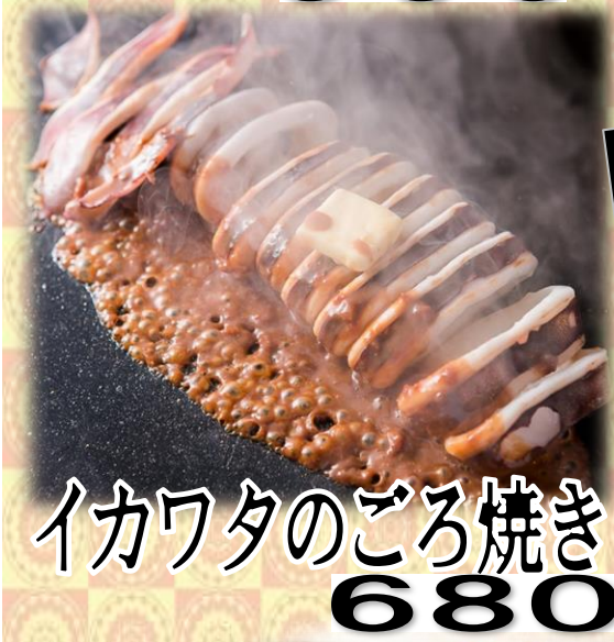
イカワタのごろ焼き 680