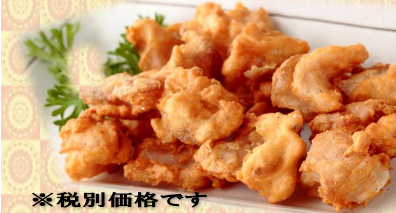
夏フェア人気NO1メニュー! 秋も継続します ホルモン唐揚げ 390