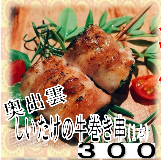
奥出雲 しいたけの牛巻(1本) 300