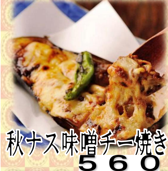
秋ナス味噌チー焼き 560